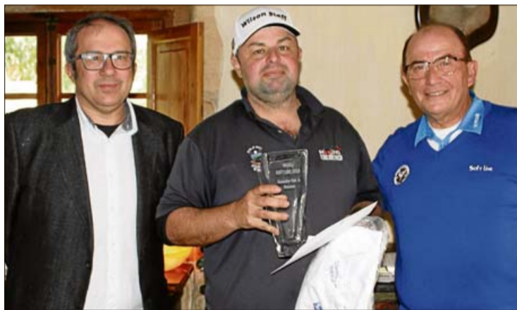
Los dos vencedores, con sus respectivos trofeos.