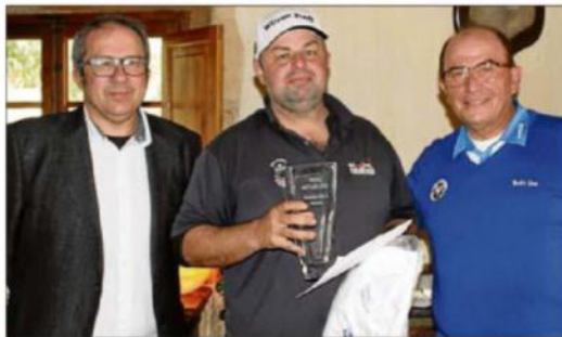
Los dos vencedores, con sus respectivos trofeos.